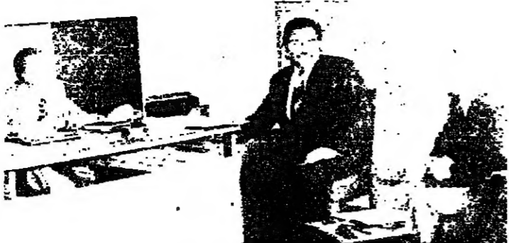
الحافظ يعالج الوضع مع موظفي الاقتصاد

القفت من الغنم والبقر ما يسوق المليوناً ليرة ومعروف أن لبنان لا ينتج كميات كافية من المواشي واللحم الصبة الاستهلاكية ، والحيوانات الضالة ساهت في نفق العديد من هذه السدان ، كما أن هذه الكميات لا تغطي سوى ٢٠ بالمائة من مجمل الحاجة الوطنية التي يفوق المليون رأس من مختلف الماشي ، والتمتوين بالإضافة لسدود من تركيا أو رومانيا أو السلطنة ، باعتبار هذه البلدان التي هي الوحيدة التي تصدر المواشي إلى الدول العربية .